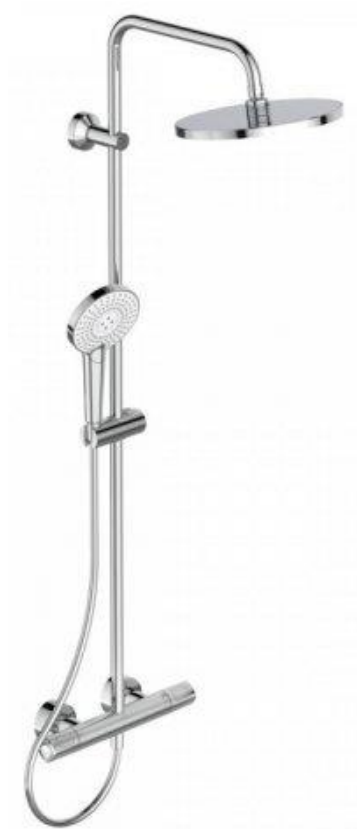
Ideal Standard Douchesysteem met Douchethermostaat met hoofddouche 12 l/min en handdouche met 3 functies 8 l/min Doucheslang Idealflex 175 cm chroom

De badkamer wordt voorzien van een elektrische handdoekradiator dnl E-Comfort Claudia EcoDesign 50 x 119,5 cm, 600 Watt, in RAL9016 met digitale thermostaat