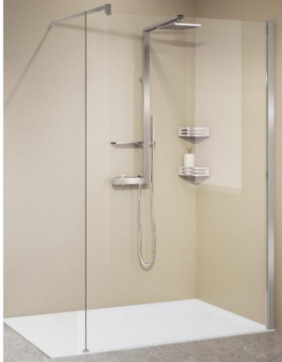
Novellini Inloopdouche Kuadra