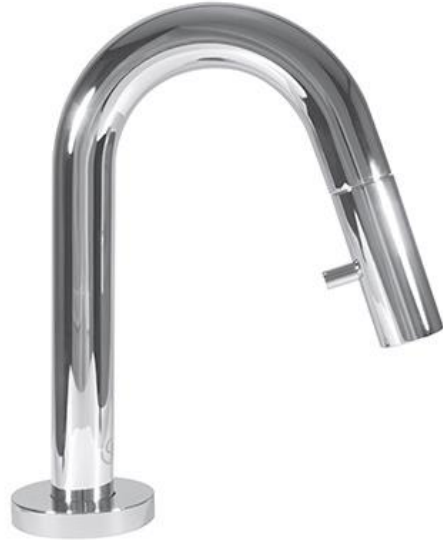
Ideal Standard Koudwaterkraan 6 l/min met hoge uitloop en geïntegreerde bediening in chroom