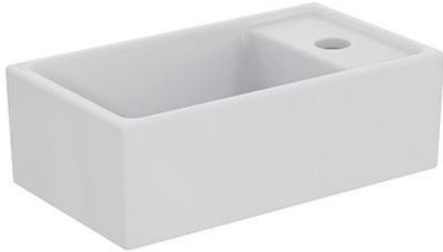
Ideal Standard Fontein 37cm x 21 cm met kraangat rechts, wit