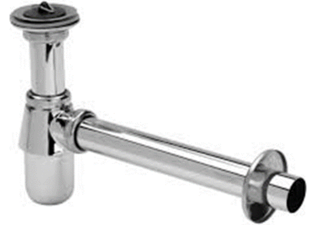
Viega Plugbekersifon met muurbuis en rozet, chroom