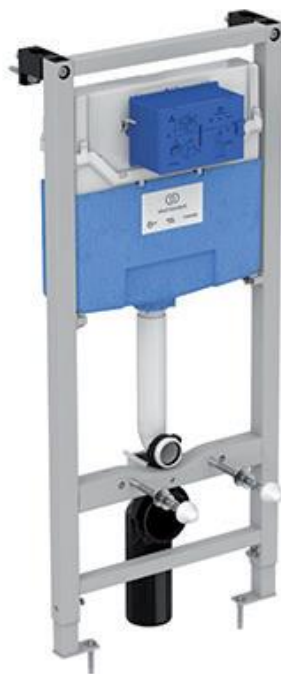
Ideal Standard Inbouwreservoir