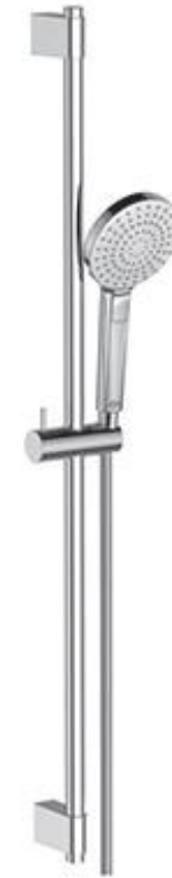
Ideal Standard Glijstangcombinatie 90 cm met handdoucheslang met 3 functies 8 l/min en Idealflex 175 cm doucheslang chrom

De badkamer wordt voorzien van een elektrische handdoekradiator dnl E-Comfort Claudia EcoDesign 50 x 119,5 cm, 600 Watt, in RAL9016 met digitale thermostaat