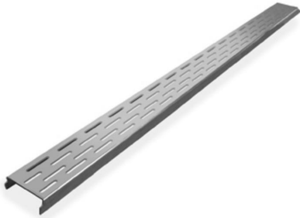
Showerdrain met RVS rooster 68,7 cm