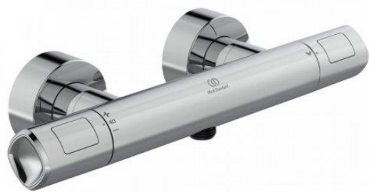
Ideal Standard Douchethermostaat cool body chrom