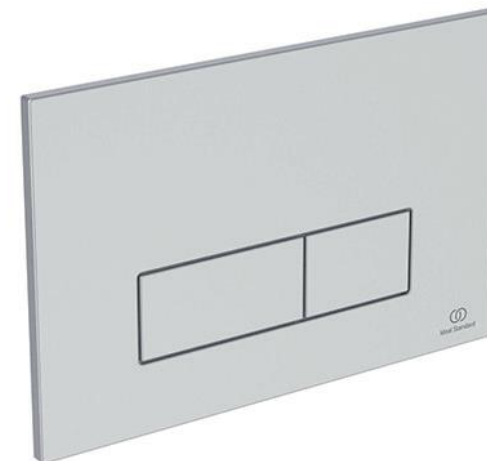
Ideal Standard Bedieningspaneel Oleas M2 mat chroom