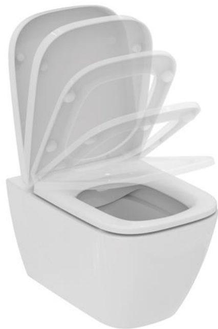
Ideal Standard Wandcloset i.life rimless met softclose zitting en deksel, kleur wit

De badkamer van bouwnummer 2, 5, 8, 11, 14 en 17 hebben standaard een extra toilet in de badkamer, bij de overige bouwnummers kan dit als optie worden gekozen.